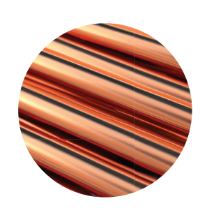
100% Copper Anti - Corrosion

สารเคลื่อบท่อทองแดงสีใสชนิดพิเศษ เพิ่ม ความแข็งแรงทนทาน ป้องกันการสึกกร่อน จากสภาพแวดล้อม และป้องกันน้ำยารั่ว